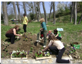
Radna akcija - uređenje parka Topole

GRANT- 805 KM Članovi udruženja su u saradnji sa 30 učenika OŠ Gornja Tuzla očistili park Topole, postavili klupe, klackalice i koševе kako bi stvorili uslove za odmor i rekreaciju.