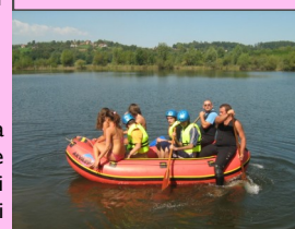
Tematski izlet članovi Udruženja Korak po

GRANT- 851 KM Neformalna grupa aktivista organizovala je tematski izlet u cilju afirmacije raftinga u zajednici i sticanja znanja iz oblasti snalaženja u vodi i u prirodi. Korisnici projekta bili su 40 mladih sa posebnim potrebama iz dva udruženja. Projekat je trajao 4 mjeseca.