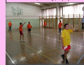
Turnir u odbojki

GRANT- 684KM Udruženje je organizovalo turnir u odbojki za 6 klubova specijalnih sportova, te preko 60 učesnika. Socijalizacija i sportski razvoj omladine sa psihičkim i tjelesnim smetnjama samo su neki od ciljeva organizacije ovog turnira.