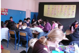
Manifestacija Dani otvorene škole

GRANT- 1000 KM Škola je u saradnji sa učenicima formirala pozorišnu grupu, izradili lutke i kulise, te scenario za predstavu sa kojom su nastupali na manifestacijama "Dani otvorene škole" i na Festivalu lutkarstva u Novom Sadu. Na ovaj način učenici su podstaknuti na bavljenje lutkarstvom i razvijanje pozorišne kulture među mladima.