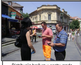
Distribucija brošura u centru grada

GRANT - 760 KM Članovi udruženja su osmislili i dizajnirali informativnu brošuru i letke o liječenju i simptomima celijakije. 500 brošura i letaka je podijeljeno u bolnici, apotekama, Domu zdravlja i u centru grada, kako bi građani dobili informacije i upoznali se sa ovom bolesti.