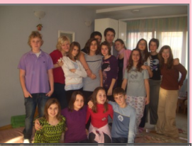
Radionica za prvu grupu

GRANT - 800 KM Projektom su održane 4 radionice za mlade uzrasta od 13 do 17 godina. Korisnici su omladinci koji su prošli program koji ima za cilj ukloniti stres i razviti samopuzdanje.