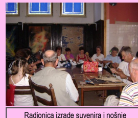
Radionica izrade suvenira i nošnje

GRANT- 1000 KM Izradom suvenira i nošnji, te edukacijom mladih o izradi ručnih radova dat je značajan doprinos u očuvanju tradicije i kulture brežakčkog kraja. Izrađenu narodnu nošnju koriste članovi folklorne sekcije, a prodajom suvenira omogućen je nastavak aktivnosti udruge.