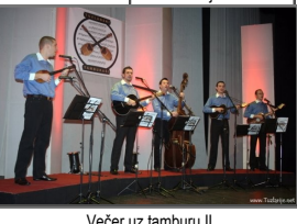
Večer uz tamburu II

GRANT - 950 KM Večer uz tamburu se organizuje već drugu godinu besplatno za sve ljubitelje starogradske pjesme i sevdalinke. Preko 600 posjetitelja koncerta je imalo priliku da poslušat bogat repertoar kojeg su pripremili 5 članova uz podršku gostiju-prijatelja tamburaša.