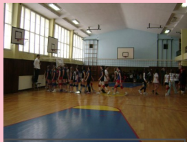
Turnir u odbojci

GRANT - 924 KM Organizovano je takmičenje turnirskog tipa iz odbojke za djevojčice i košarke za dječake, te predavanja za voditelje sekcija i same takmičare. Korisnici su bili 200 mladih ljudi.