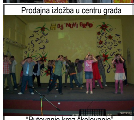
"Putovanje kroz školovanje"

GRANT - 500 KM "Putovanje kroz školovanje" je naziv izložbe koju je organizovala neformalna grupa OŠ Novi grad. Vremeplovom školovanja učenika 9-godišnjeg obrazovanja ostvarena je bolja saradnja na relaciji učenik-nastavnik-roditelj.