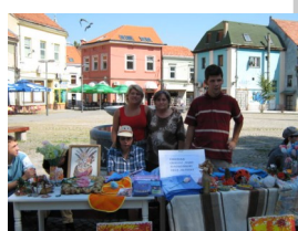
Prodajna izložba u centru grada

GRANT - 1000 KM Udruženje je organizovalo radionice šivenja i pletenja za 16 djece sa posebnim potrebama. U okviru projekta održan je i okrugli sto o poboljšanju uslova življenja osoba sa posebnim potrebama. Obezbjedena je samoodrživost projekta zahvaljujući prodajnim izložbama.