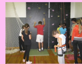
Škola sportskog penjanja

GRANT- 1000KM Članovi društva su postavili vještačku stijenu u sali Fakulteta za tjelesni odgoj i sport, te organizovali školu sportskog penjanja za djecu. U okviru projekta omogućeno je i izdavanje priručnika koji će koristiti u promociji ovog sporta.