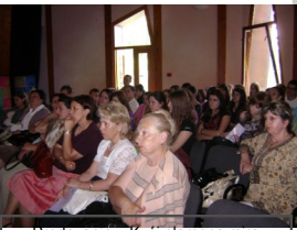
Predavanje u Kući plamena mira

GRANT - 500 KM Organizovan je memorijalni šahovski turnir na kojem je učestvovalo 11 osoba iz tri udruženja i čas historije za 19 članova udruženja.