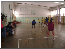
Turnir u odbojci za pionirke

GRANT - 960 KM Četiri odbojkaška kluba i tri osnovne škole imale su priliku da se takmiče na turnira u odbojci za pionirke. Koristi od projekta imalo je preko 95 omladinaca iz Tuzle.