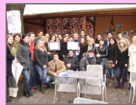
Međunarodni dan volontera

GRANT- 1000KM Nastavkom rada LVS-a organizovane su edukacije o volonterskom menadžmentu koje je prošlo 8 organizacija i 40 volontera iz baze. Brojnim aktivnostima obilježen je Međunarodni dan volontera kada su najvredniji volonteri dobili nagrade, a u zajednici je i promovisan volonterizam kao znatan doprinos razvoju društva.