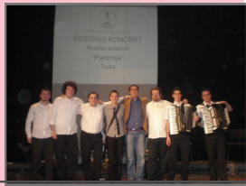
Muzički koncert FA Panonija

GRANT - 600 KM Promotivni koncert muzičkog ansambla organizovan je u saradnji sa vokalnim solistima iz Tuzle. Manifestaciju sa bogatim zabavni programom posjetilo je oko 400 građana.